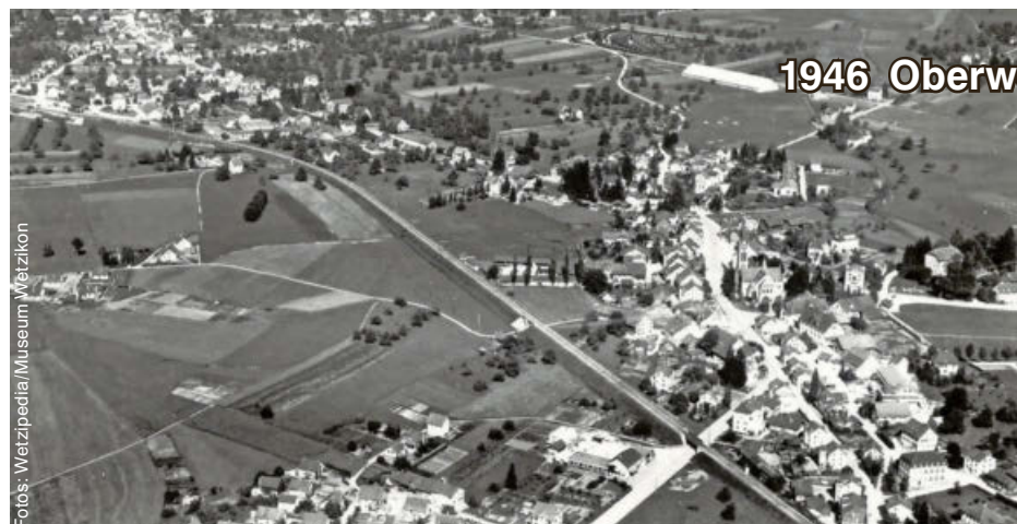
1946 Oberwetzikon 2020

Ende Januar beschliesst der pensionierte Lehrer kurzerhand, mithilfe eines Freundes und von dessen Drohne die Flugaufnahmen nachzustellen – als Vergleich zu den historischen Bildern. Dafür reist er quer durch die Region, um die identischen Standorte